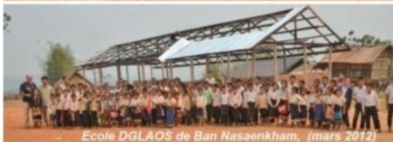
Ecole DGLAOS de Ban Nasaenkham, (mars 2012)

merci aux donateurs avec la Fondation du GODF (depuis 2009) et une dizaine d'ong, assoc. et entreprises.