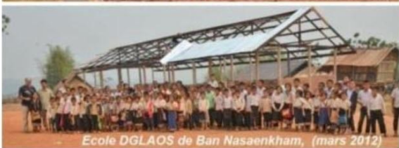
Ecole DGLAOS de Ban Nasaenkham, (mars 2012)