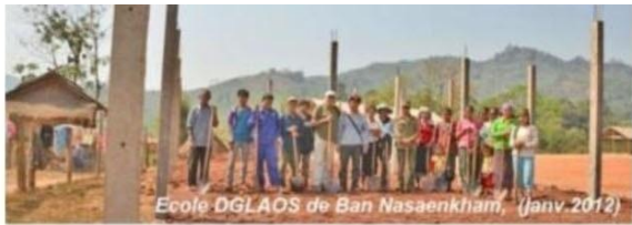
Ecole DGLAOS de Ban Nasaenkham, (janv. 2012)