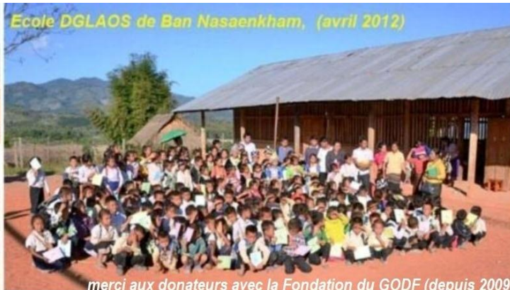
Ecole DGLAOS de Ban Nasaenkham, (avril 2012)