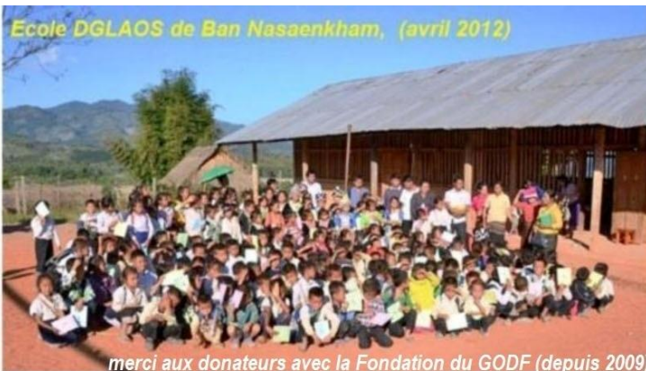
Ecole DGLAOS de Ban Nasaenkham, (avril 2012)