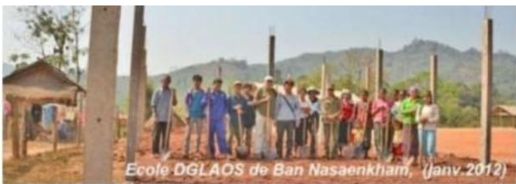
Ecole DGLAOS de Ban Nasaenkham, (janv. 2012)